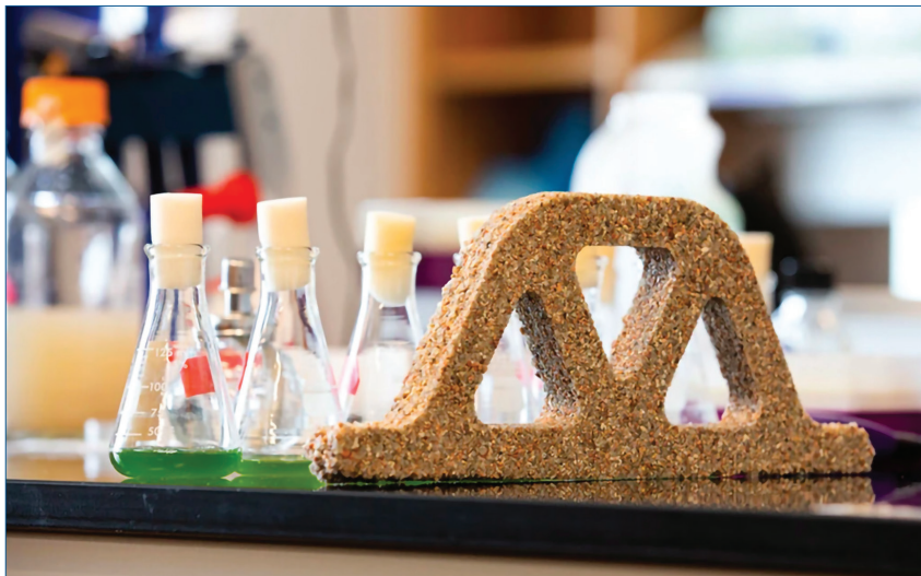
Fig. 2 - Preparazione in laboratorio di un mattone autoreplicante [5]

La sua forma cristallografica dipende dalla composizione e dalla struttura del substrato con cui i batteri interagiscono: per es. Brevundimonas diminuta (batterio Gram negativo) porta alla formazione di vaterite (carbonato di calcio cristallizzato in un sistema esagonale). I processi di biomineralizzazione con formazione di carbonato di calcio per opera