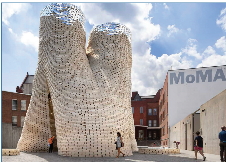
Fig. 3 - Padiglione di 12,2 m di fronte al MOMA (Progetto The Living ) [6]

Ricercatori della Columbia Graduate School of Architecture, Planning and Preservation dello Stato di New York hanno